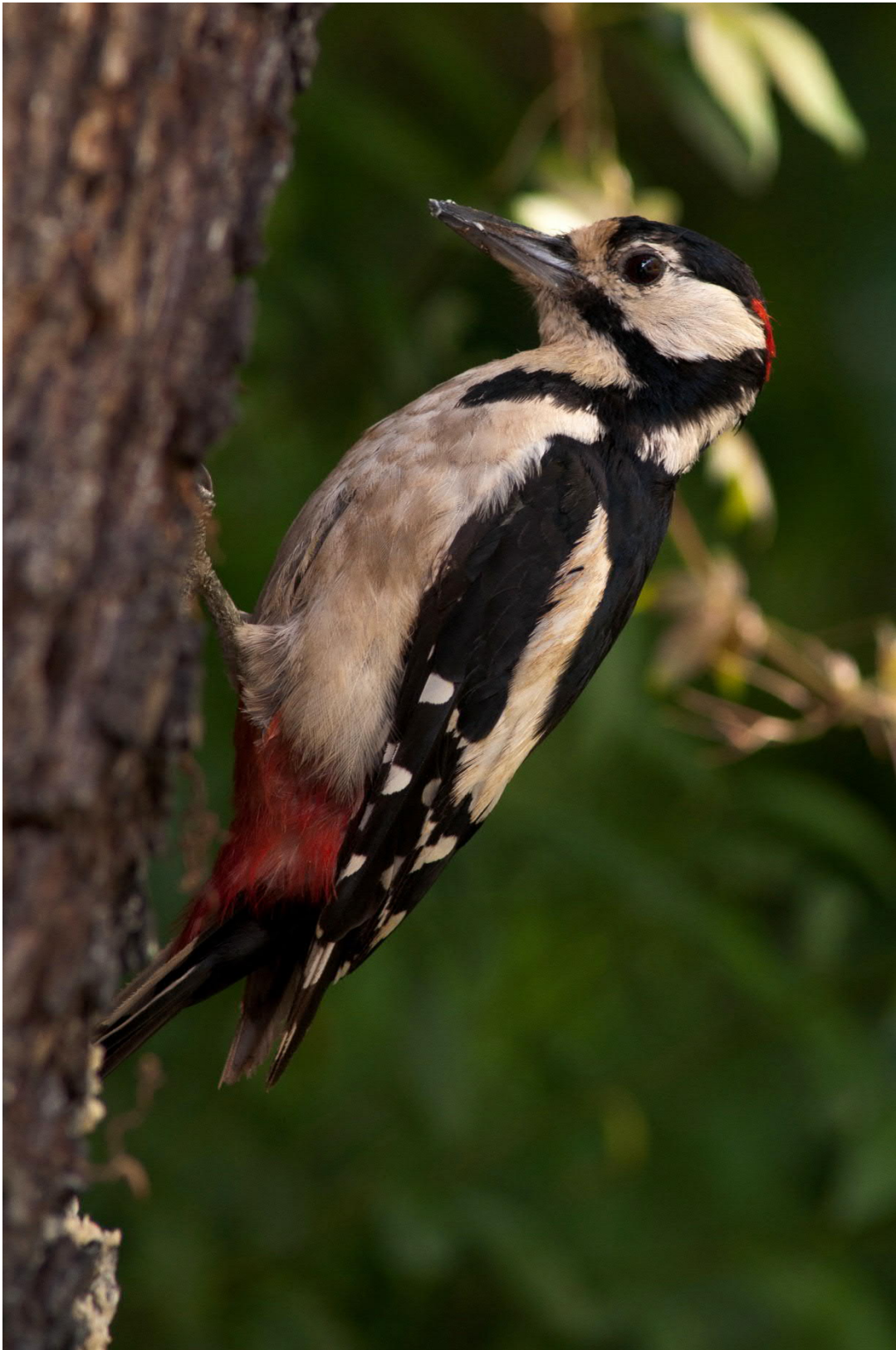
Ganzjährig am Futterplatz. Männchen mit rotem Fleck am Hinterkopf. Beim Weibchen fehlt der rote Fleck. Hinterkopf des Weibchens ist Schwarz.