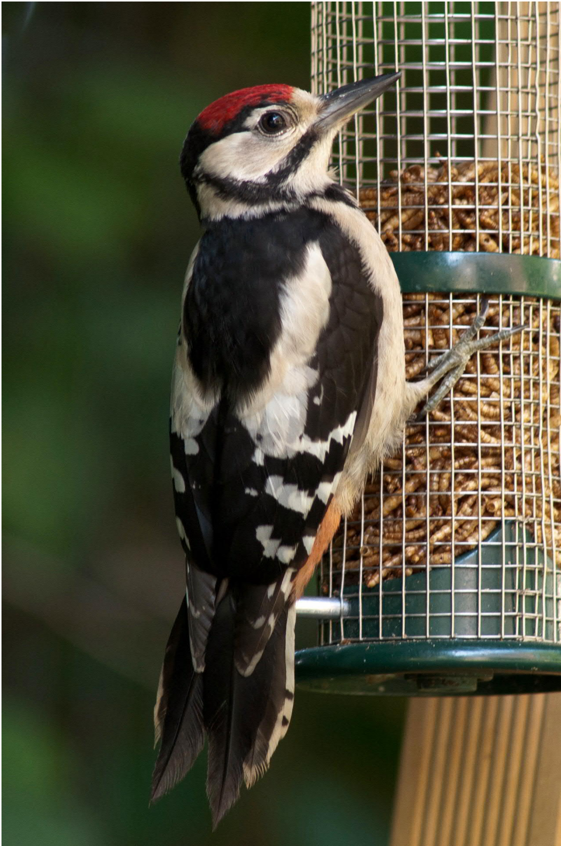
Junger Specht frisst Mehlwürmer