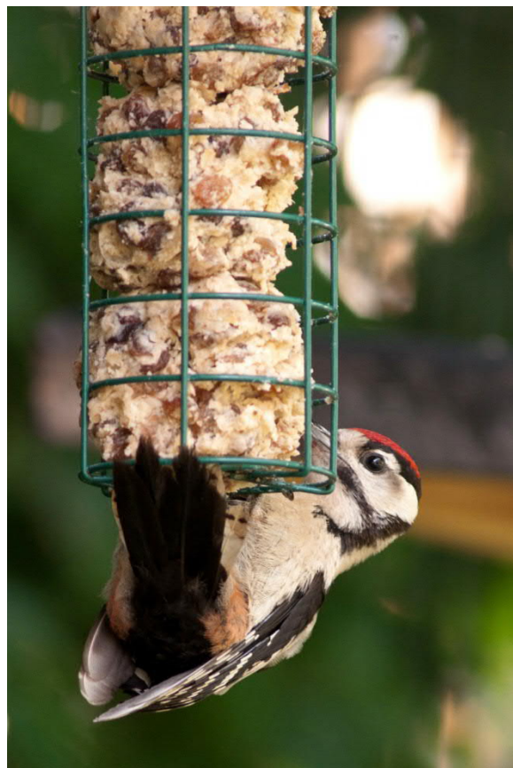
Jungspecht frisst Meisenknödel mit Rosinen